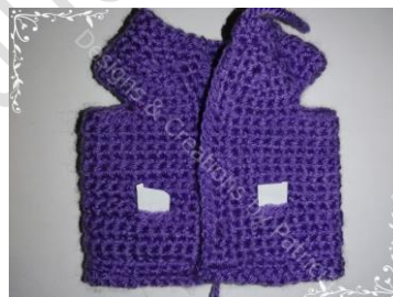
Buitenkant jas (papiertje in de zakken gestoken)

Naai de knoopjes aan. Werk alle draadjes onzichtbaar weg.