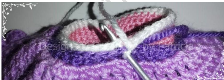
Foto werd in een andere kleur gemaakt zodat je het beter kan zien.

Tr 10: Neem het eerste stokje van de rok (neem de 2 lusjes van de steek) EN de volgende steek van het lichaam en haak 1v (zie foto), doe dit nu ook met de volgende 39 stokjes EN steken samen (40)