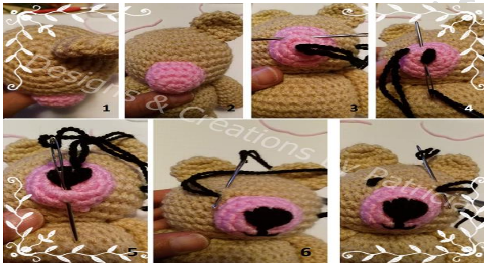
Foto 1 en 2 toont waar je begint om de oren vast te naaien.

Naai het hoofd aan het lichaam, gebruik de eerste toer bij hoofd en lichaam. Zo moet het er uit zien.