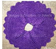
Ansicht von unten