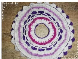
Ansicht von oben

Abmaschen und alle Fäden unsichtbar vernähen.