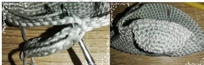
Zusammenhäkeln der Wange

Tr 16: 22 FM, nimm eine Wange und nimm diese doppelt, steche mit der Nadel durch 2 Maschen und die folgenden Masche am Kopf (siehe Foto), 1 FM, noch 2 FM in die gleiche Masche, die nächsten 9 FM auf die gleiche Weise zusammen häkeln (Es wurden insgesamt 10 Maschen zusammen gehäkelt mit 30 FM), 1 FM, 1LM (hier kommt später die Nase hin), 1 Masche auslassen, 1 FM, die zweite Wange dazunehmen, nimm diese doppelt und steche mit der Nadel durch 2 Maschen der Wange und die folgende Masche am Kopf, 1 FM, noch 2 FM in die gleiche Masche, die nächsten 9 FM auf die gleiche Weise zusammen häkeln (Es wurden insgesamt 10 Maschen zusammen gehäkelt mit 30 FM), 21 FM (106)