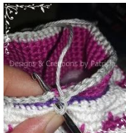
Den Rock anhäkeln