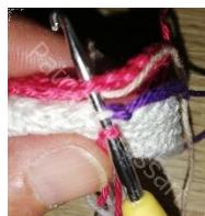
Foto is van een ander patroon van mezelf, maar het principe blijft gelijk.

Leg nu de zool met de goede kant naar onder tegen de zool van je schoen. Haak de zolen nu aan mekaar als volgt; neem de volgende steek op je zool EN de overgebleven lus op je schoen (zie foto), en haak *1hv*, herhaal ** tot einde toer. Sluit met 1hv in de 1 e steek en hecht af . Vergeet je karton er niet tussen te steken alvorens je helemaal rond gehaakt hebt.