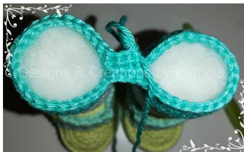
Foto komt uit een ander patroon van mij, maar het principe blijft hetzelfde.