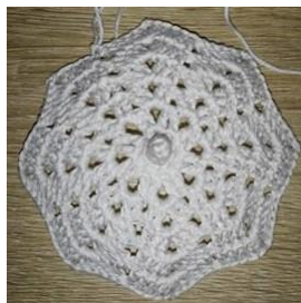
foto na toer 10

Tr 10: 1hv, 3L, 2stk, (2stk, 2L, 2stk) in de LR, 3stk, sla 2stk over, *3stk, (2stk, 2L, 2stk) in de LR, 3stk, sla 2 stokjes over*, herh ** tot einde toer, sluit met 1hv in de 3 e losse (80)