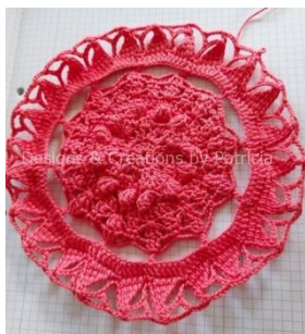
Foto na toer 13

Tr 14: 3L (telt als 1 e stokje), 4stk in de LR, *1stk op het stokje van vorige toer, 4stk in de LR* herh ** helemaal rond, sluit met 1hv in de 3 e losse (240)