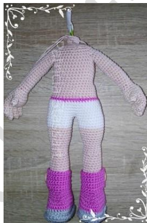
Foto is niet van deze pop, maar het principe is hetzelfde.

Steek je draad in het hoofd ter versteviging en het andere eind in het lichaam. Vul de nek op.